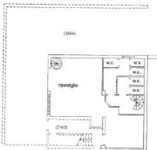
PIANO S1 h=2.40